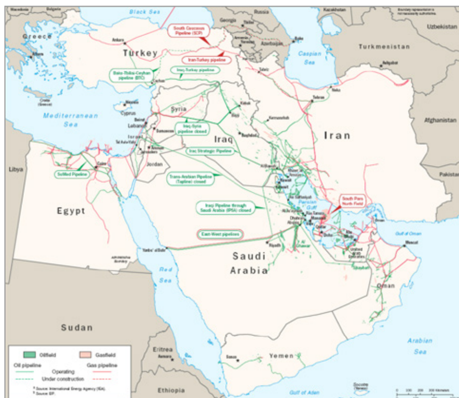
Figura 1: Infraestrutura de dutos no Oriente Médio